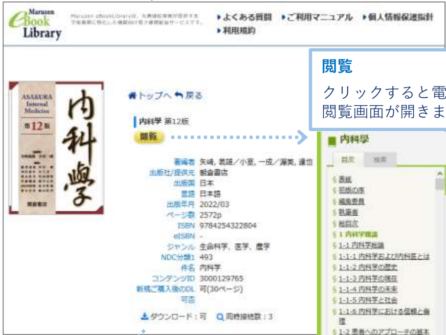
[例：Maruzen eBook Library_書籍情報画面]